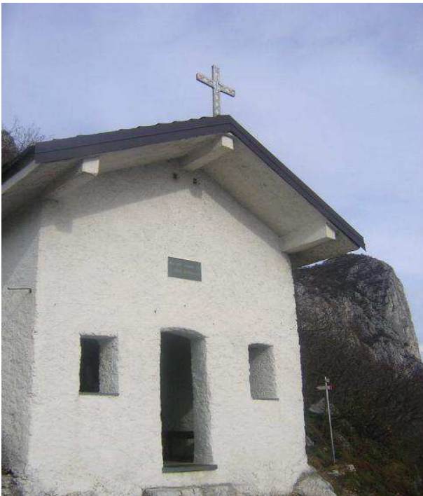
Dietro la Cappella della Madonna del Carmine una tabella

sulla destra indicazioni per la ferrata del Corno Medale (quota 545 mt) e continuare in leggera salita per circa 500 mt. fino ad una piccola cappellina raffigurante la Madonna (quota 580, 1 ora dalla partenza). Sulla destra della cappellina parte il sentiero no 52 con gradini scavati nella roccia e tratto catenato, segnava Bianco/Rosso. In seguito il sentiero è segnalato con 3 pallini rossi. A quota 630 mt ignoriamo la deviazione per in sentiero della Vergella e continuiamo a destra sul sentiero principale in direzione Nord Ovest in decisa salita fino ad un bivio posto a quota 680 mt (Saltarei) che ignoriamo, tenendo la sinistra, seguendo sempre il segnava con i 3 pallini rossi. A quota 740 mt. superiamo la deviazione per il sentiero 56A Corno Medale a destra, continuando sul sentiero principale fino alla Chiesetta del Carmine (746 Mt, 1 ora e 30'), posizionata in bel punto panoramico.