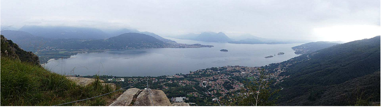
Cartografia: Geo4map 1:25000 N° 117 Mottarone Lago Maggiore.